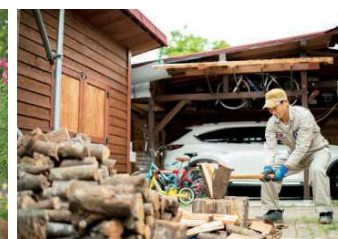
左 / 「植物によって成長速度が違うので一度に完成しないのが面白いんです」と光さん 右 / 森を元気に保つために間伐した木の一部は、薪として再利用。「安芸太田町は山の面積が大きいので維持・有効活用できるように尽力したい」と賢さん