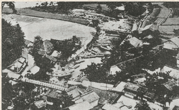
加計の船付場(明治43年頃)

現在、太田川は飲料水の供給など大切な役目を果たしており、昔も今も広島にとって多大な恩恵を与えてくれる「母なる大河」として親しまれています。